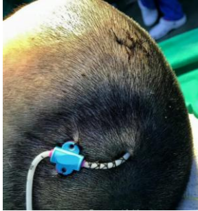
Cateter para drenagem liquórica