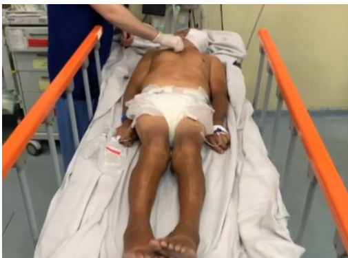
Paciente em estado de descerebração

A HIC pode ocasionar cefaléia intensa, que piora com o repouso e em decúbito dorsal devido à dificuldade do retorno venoso; vômitos em jato, letargia e sonolência; paresia e plegia, diplopia; anisocoria; midríase bilateral e, em casos mais severos, pode ocorrer herniação cerebral. Com o agravamento da PIC, há uma alteração severa na consciência, rebaixando-a; assim, o paciente pode entrar em coma e, ao ser realizada a avaliação do nível de resposta motora pode apresentar decorticação e descerebração.