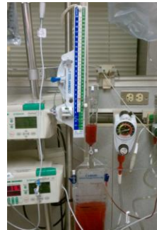
Sistema de derivação ventricular externa DVE